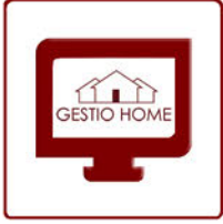
Plataforma Gestio Home Integrada