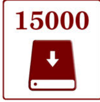
Hasta 15.000 Dispositivos 30 Instalaciones