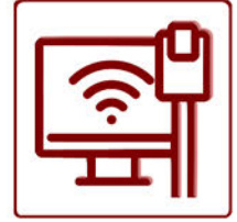
Versiones Ethernet / 3G